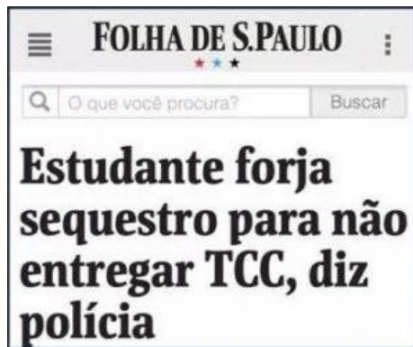
Figura 1 - Folha de São Paulo

É um assunto que causa espanto e desespero para muita gente, a ponto de acontecer isso: